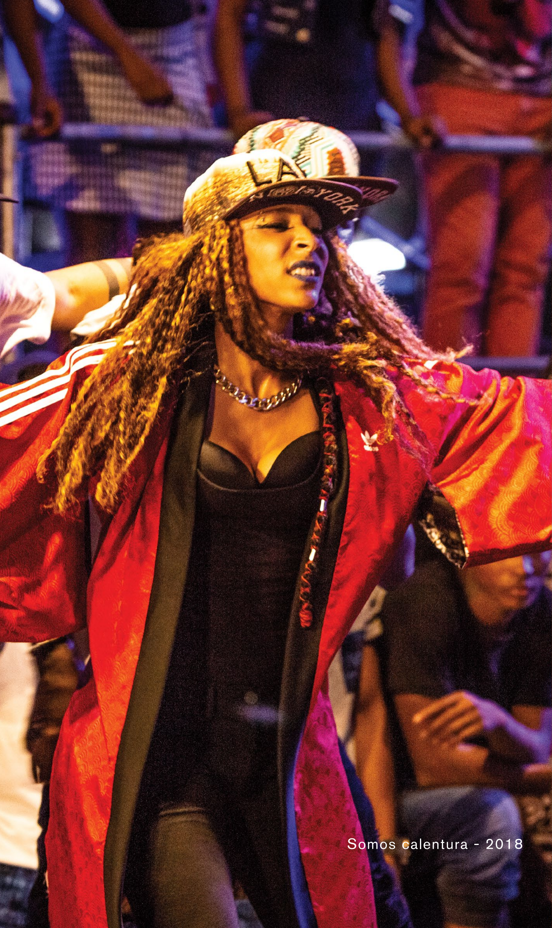
Somos calentura - 2018