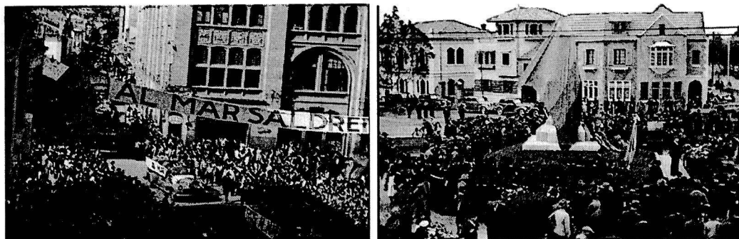
Carretera al mar, 1928.